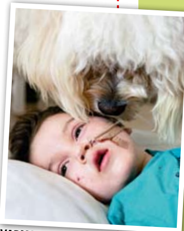
VARM NOS. Närheten av en hund minskar stressen hos oroliga barn.