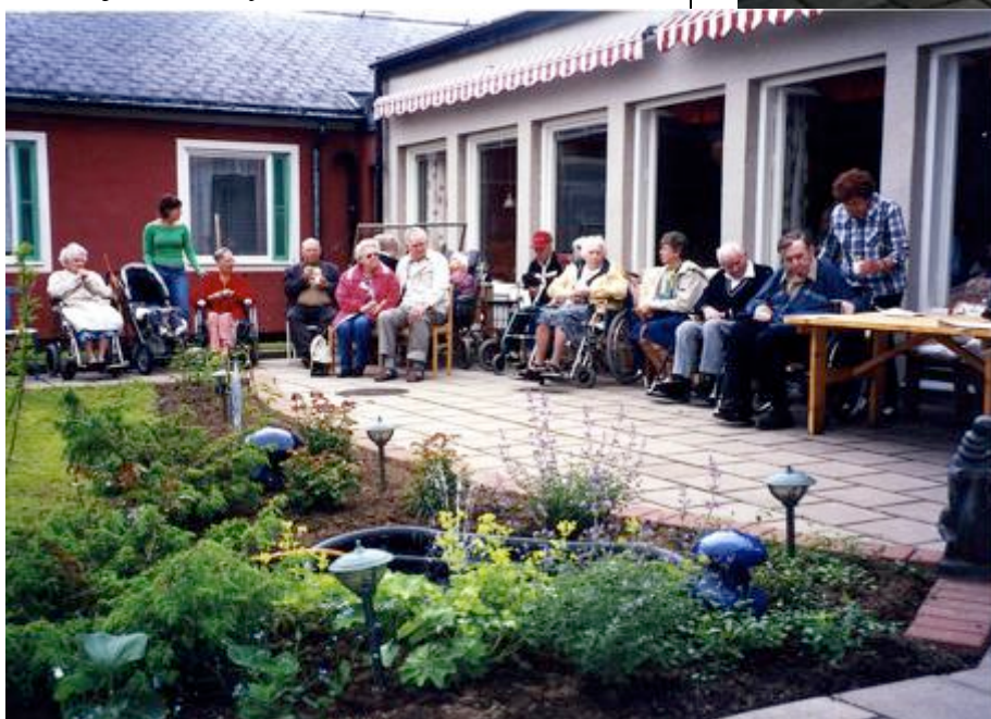
Tallmons äldreboende i Skutskär, före och efter renovering av innergård.